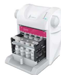
QuickGene-Mini8L Lキット用 手動タイプ 298,000円