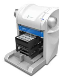
QuickGene-Mini480 Mini80後継機種 手動タイプ 198,000円