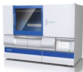
QuickGene-Auto240L 610L後継機種 全自動タイプ 9,800,000円